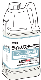
ライムリスターミニ