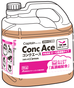
キャプテンコンクエース 5KG